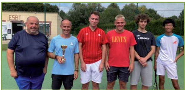
A eu lieu le 4 septembre un TMC Hommes 3ème

Venez nous rendre visite à l'occasion de ces différentes manifestations