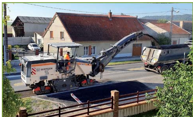
Rabotage de la chaussée

*nous rappelons que la RD933 fait partie du Réseau Structurant concernant les Convois Exceptionnels et que nous ne pouvons pas faire n'importe quelle sorte de travaux et que nous sommes soumis à l'avis de la Préfecture.