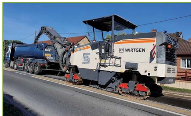
Rabotage de la chaussée