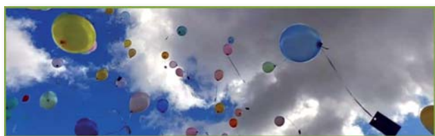
lâcher de ballons

Les enfants ont ainsi pu bénéficier début juillet d'un lâcher de ballons suivi d'un petit goûter. Nous précisons que les enfants dont la carte accrochée au ballon nous sera retournée, seront récompensés par la remise d'un beau livre.