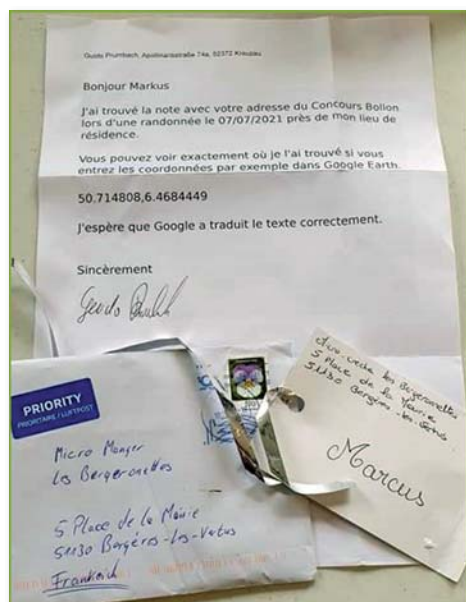
carte d'un ballon retrouvée en Allemagne !

A l'occasion des kermesses de fin d'année, qui en raison de la situation sanitaire ont dû se tenir respectivement dans leurs cours d'écoles