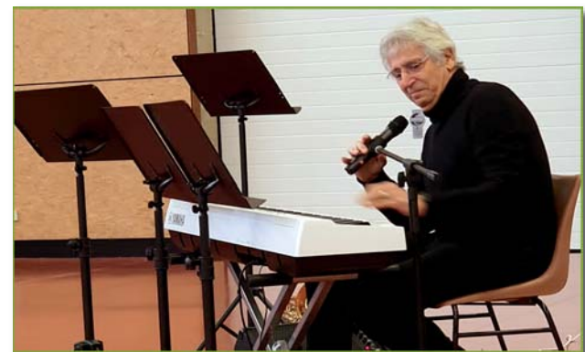
Interprétation chanson "L'essentiel" par Yves Duteil pour les enfants et les parents.