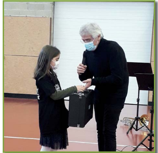
Remise d'un instrument à une élève par Yves Duteil