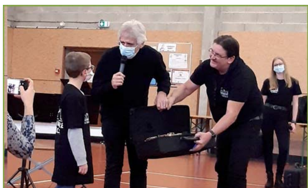
Remise d'un instrument à un élève par Yves Duteil

Nous remercions tous les organismes financeurs et les partenaires.