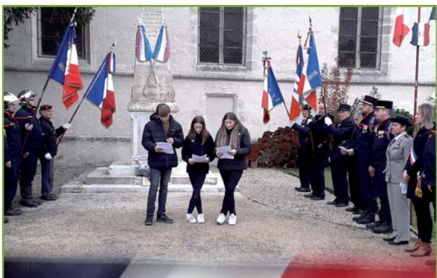
Participation de 3 élèves de la Classe Défense du collège Eustache Deschamps de Vertus - Blancs Coteaux par la lecture de textes.