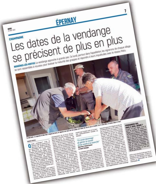
Article de M. MASCOLI Maxime, paru dans l'Union du 29 août 2022

Sans oublier « le réseau matu » qui est nécessaire, la maturité de nos raisins est un paramètre important pour les dates de vendanges. Nous rappelons que ce dernier concerne l'ensemble du vignoble de la commune et est ouvert à tous les viticulteurs de Bergères.