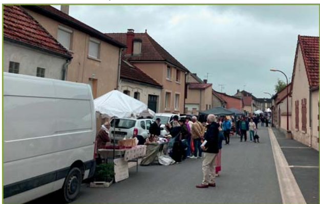
rue des Mottes