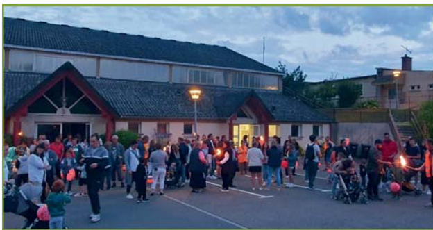
Défilé aux flambeaux