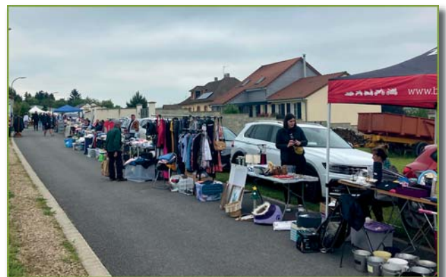
rue des Berceaux

Afin de ravir les petits et les grands, la restauration était assurée par Sylvie et Eric Aubin et leur food truck, brasero et hamburgerie. Les manèges et confiseries de la fête patronale traditionnelle animaient cette journée.