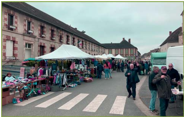
place de la Mairie