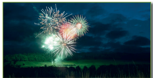
Feu d'artifice 2024

L'ensemble du cortège formé est alors monté jusqu'aux pieds des vignes, et s'est installé pour admirer le feu d'artifice tant attendu par tous !