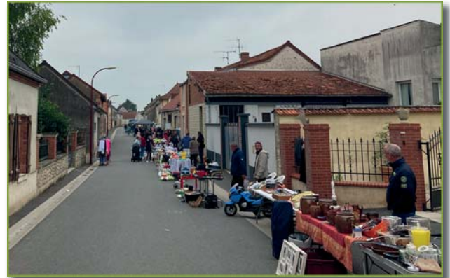
rue des Mottes

Nous avons eu le plaisir d'avoir plus de 85 exposants, particuliers et professionnels, qui ont exposé tout au long de ce nouveau parcours. Nos exposants étaient installés place de l'église mais aussi dans la rue des Mottes et dans la rue des Berceaux sans interruption, proposant ainsi aux visiteurs un parcours au centre du village.