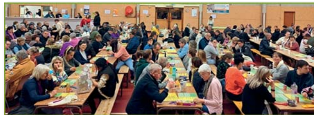
Loto du vendredi 19 avril

Notre traditionnel Loto s'est déroulé le vendredi 19 avril. Ce fut un succès : de nombreux joueurs sont venus tenter leur chance (plus de 400). Un grand merci à tous nos généreux donateurs qui nous permettent d'équilibrer notre budget.