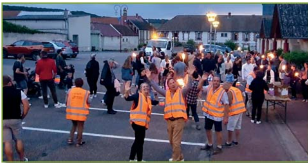
Défilé aux flambeaux

Petits et grands ont défilé avec lampions et torches dans les rues du village jusqu'au lieu du tir du feu d'artifice qui a été magnifique pour clôturer cette belle soirée du 13 juillet et qui a enchanté les personnes présentes pour le plaisir de toutes et tous !