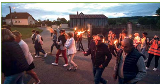
Défilé aux flambeaux

Le verre de l'amitié a conclu cette soirée républicaine !