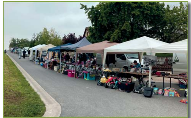
rue des Mottes