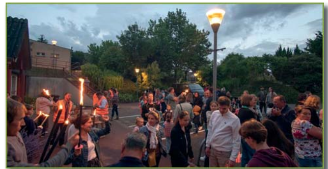
Défilé aux flambeaux